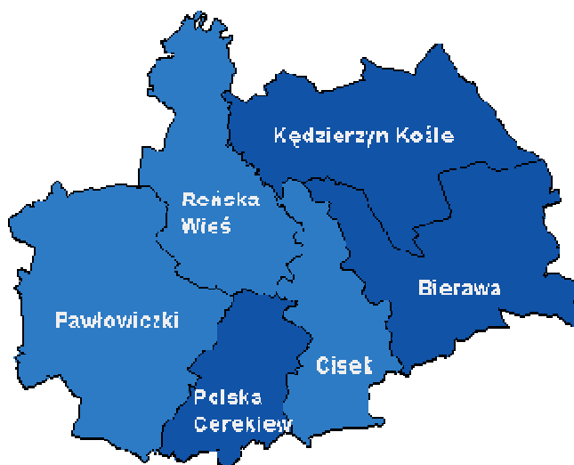
Rys. 1 Mapa powiatu Kędzierzyn - Koźle